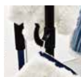
センターシャフト用フック